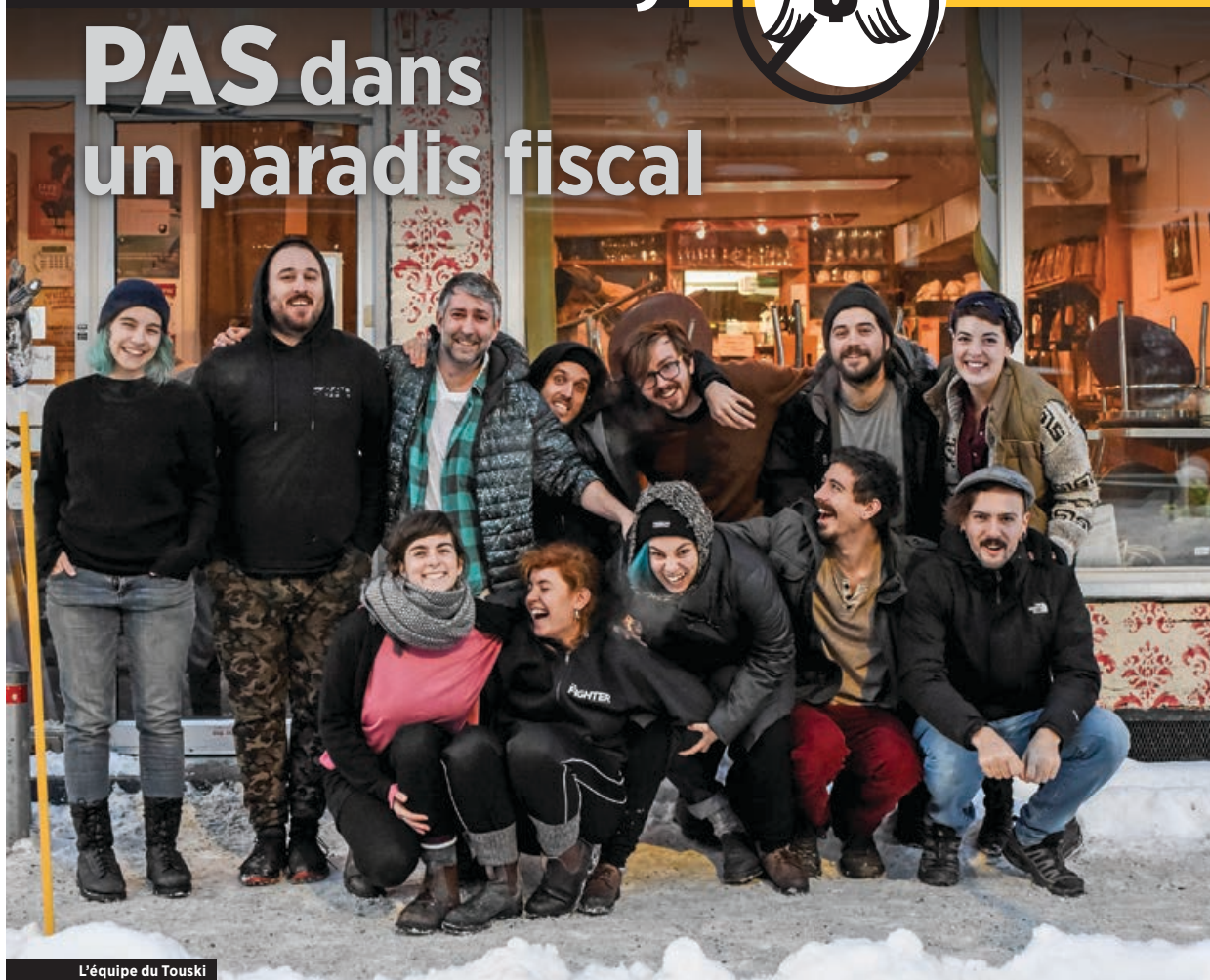
L'équipe du Touski

L'AGA-Rendez-vous solidaire 2017 a été un événement écoresponsable exceptionnel, une certification de niveau 5 sur 5 .