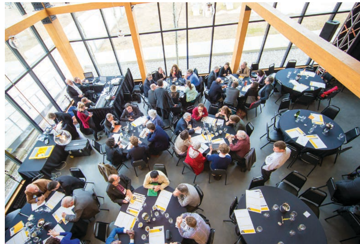
Ateliers de travail lors du Rendez-vous solidaire 2017

Contribuer , avec d'autres acteurs nationaux et internationaux , au développement d'un mouvement de la finance solidaire .