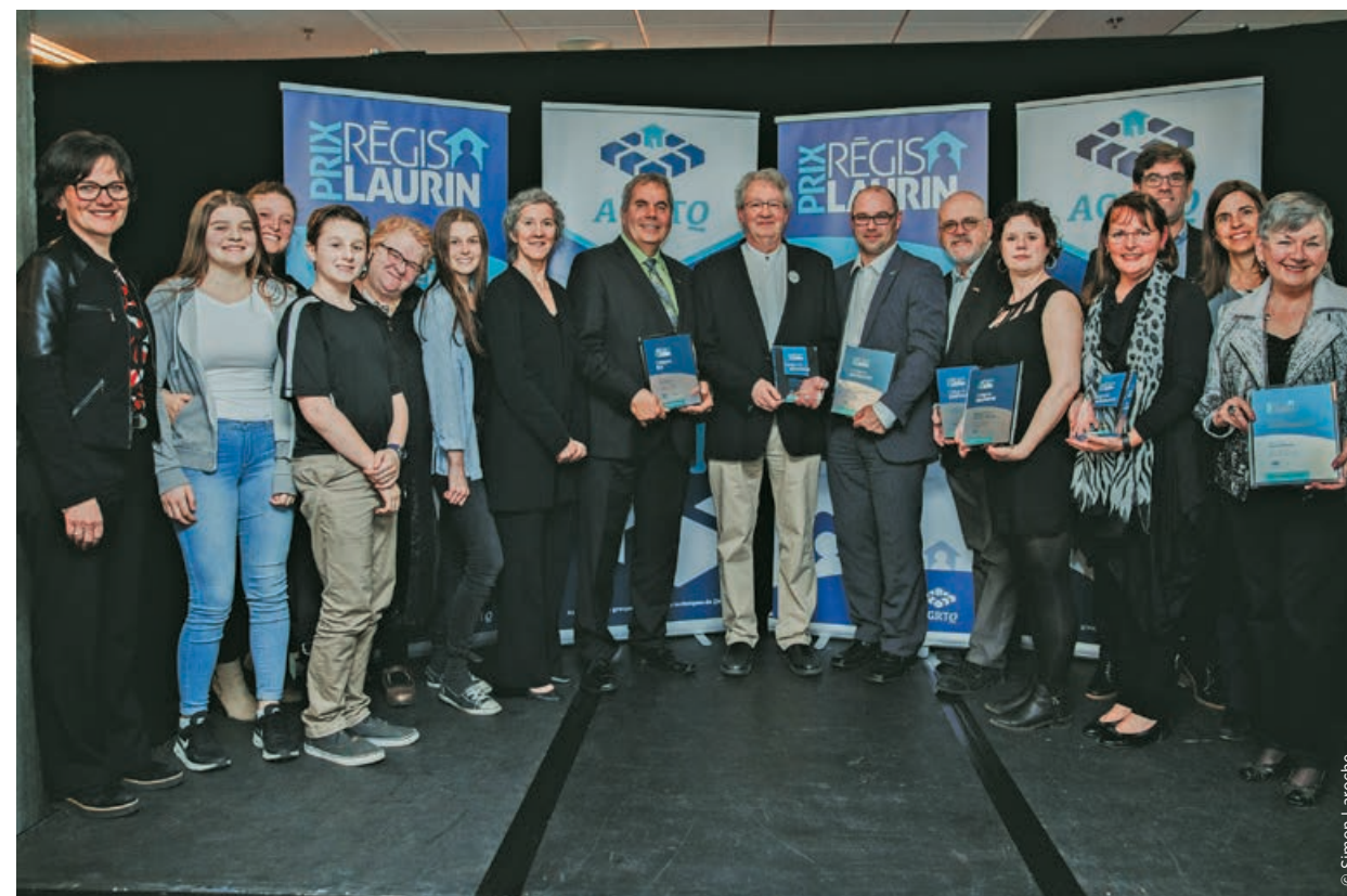
Lauréats et lauréates des Prix Régis-Laurin 2017