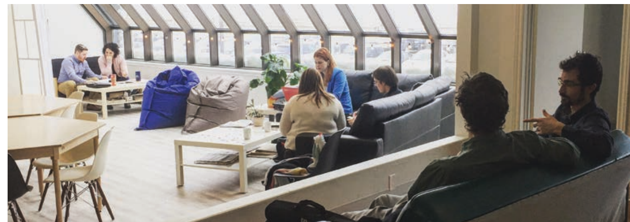
La Station, un espace de cotravail à Rimouski, a bénéficié du programme JEC.