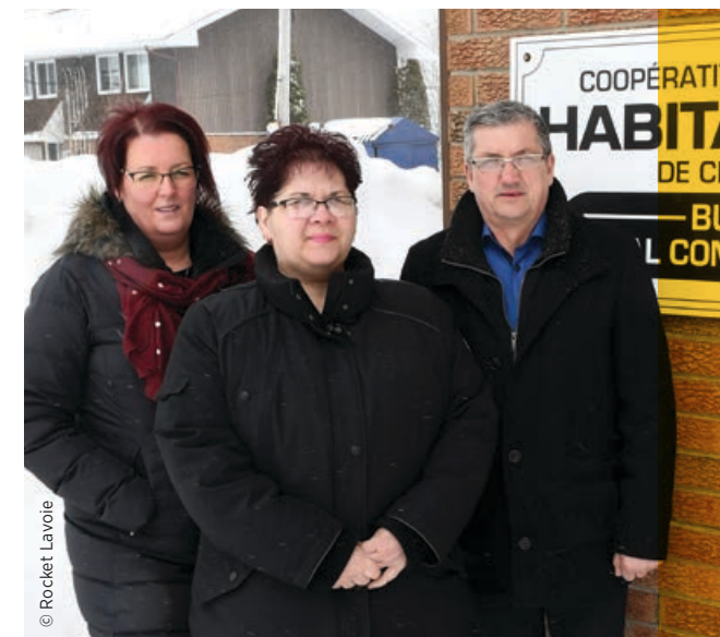
Coopérative d'habitation Habitat 2000 , refinancée pour des rénovations Chicoutimi

organismes d'habitation communautaire membres