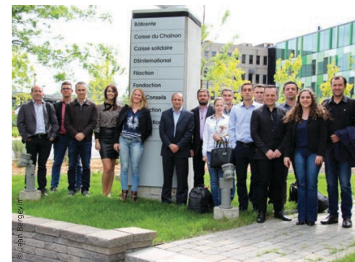
L'équipe de CRESOL SICOPER au point de service de Montréal

La Caisse poursuit sa coopération avec CRESOL SICOPER. Dans la foulée, 16 professionnels et cadres ainsi que le président de la Fédération de coopératives brésiliennes CRESOL SICOPER se sont intéressés au fonctionnement de la Caisse et de la Fédération des caisses Desjardins. Ce réseau de 24 coopératives d'épargne et de crédit du Brésil est implanté dans 250 municipalités, rurales pour la plupart. Il compte plus de 93 000 membres. Depuis 20 ans, CRESOL SICOPER contribue au maintien et à la valorisation de l'agriculture familiale de manière solidaire et responsable.