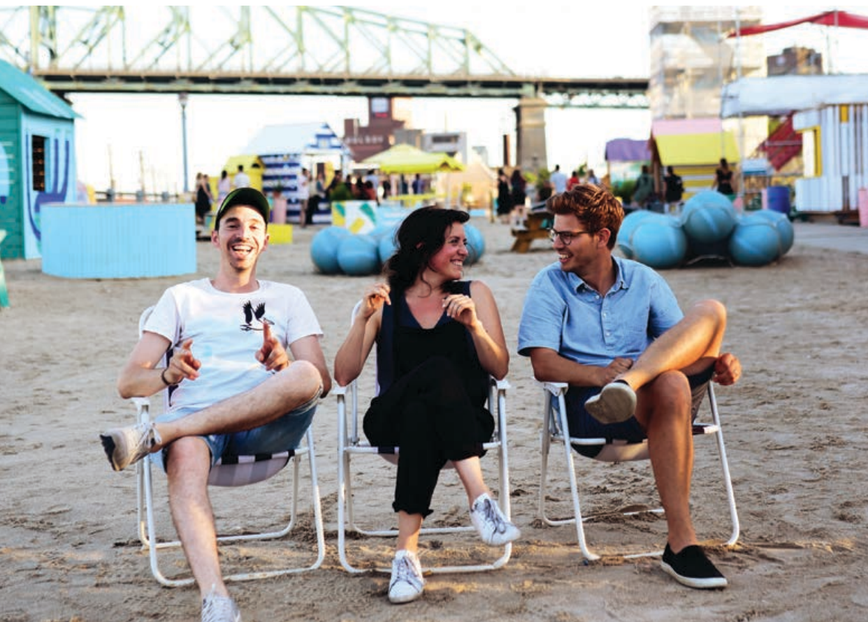
La Pépinière | Espaces collectifs

Sa programmation diversifiée présente des spectacles en chanson, en musique, en humour et en théâtre.