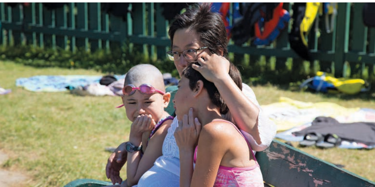
Le Fonds de soutien à l'action collective et solidaire, engagé avec la Fondation camp vol d'été Leucan-CSN

Créé en 1983 à l'initiative de la Caisse et des syndicats, le Fonds est un outil financier juridiquement distinct et complémentaire servant à soutenir des syndicats en conflit et à aider des entreprises collectives ayant besoin d'un coup de pouce temporaire.