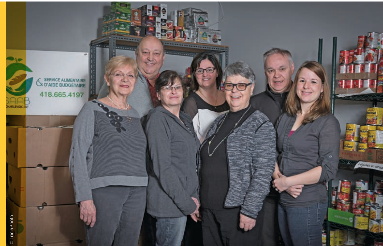
Le Service alimentaire et d'aide budgétaire de Charlevoix-Est

Une nouvelle épicerie zéro déchet offre des produits en vrac et des plats de prêt-à-manger. Québec