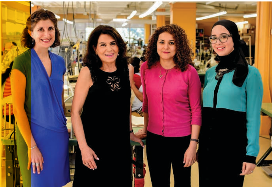
Petites-Mains , une entreprise d'insertion pour femmes immigrantes, en campagne de financement majeure (2017-2020) Montréal