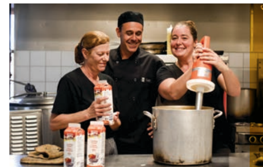
Le traiteur Buffet Accès Emploi , une entreprise d'insertion, a bénéficié du Fonds INNOGEC.

La Caisse d'économie solidaire s'est alliée à Filaction et à Fondation pour créer le Fonds INNOGEC . Constitué en partenariat avec le ministère de l'Économie, de la Science et de l'Innovation, le Fonds INNOGEC donne accès à des services-conseils en gestion et en gouvernance. Pas moins de 150 000 $ ont été versés sous forme de contributions non remboursables pour 23 projets (paiement d'honoraires professionnels découlant de services-conseils).