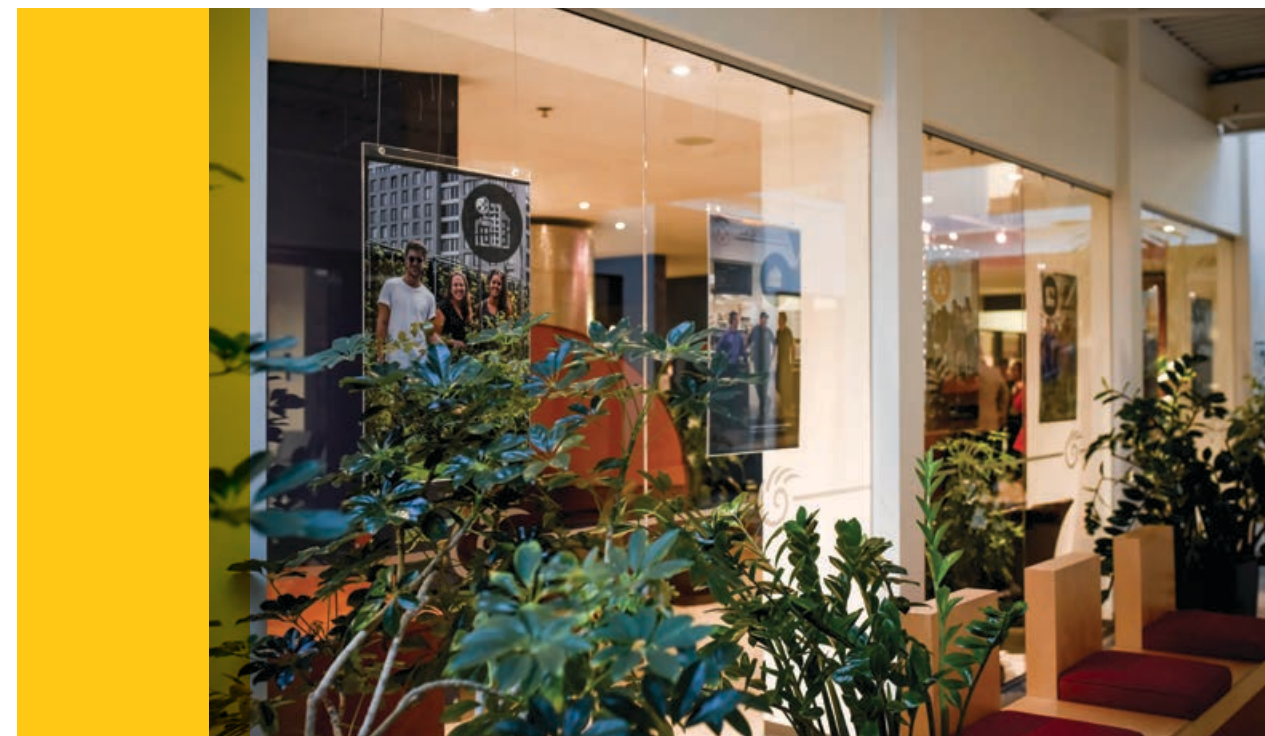
Point de service de Montréal