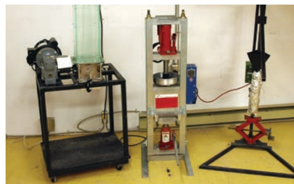
Coop Bleu Ouvert a obtenu une contribution financière pour le démarrage d'une coopérative combinant la technologie libre et le «DIY» afin de rendre accessible la revalorisation (transformation) d'objets de plastique, dans une perspective d'économie circulaire et sociale.