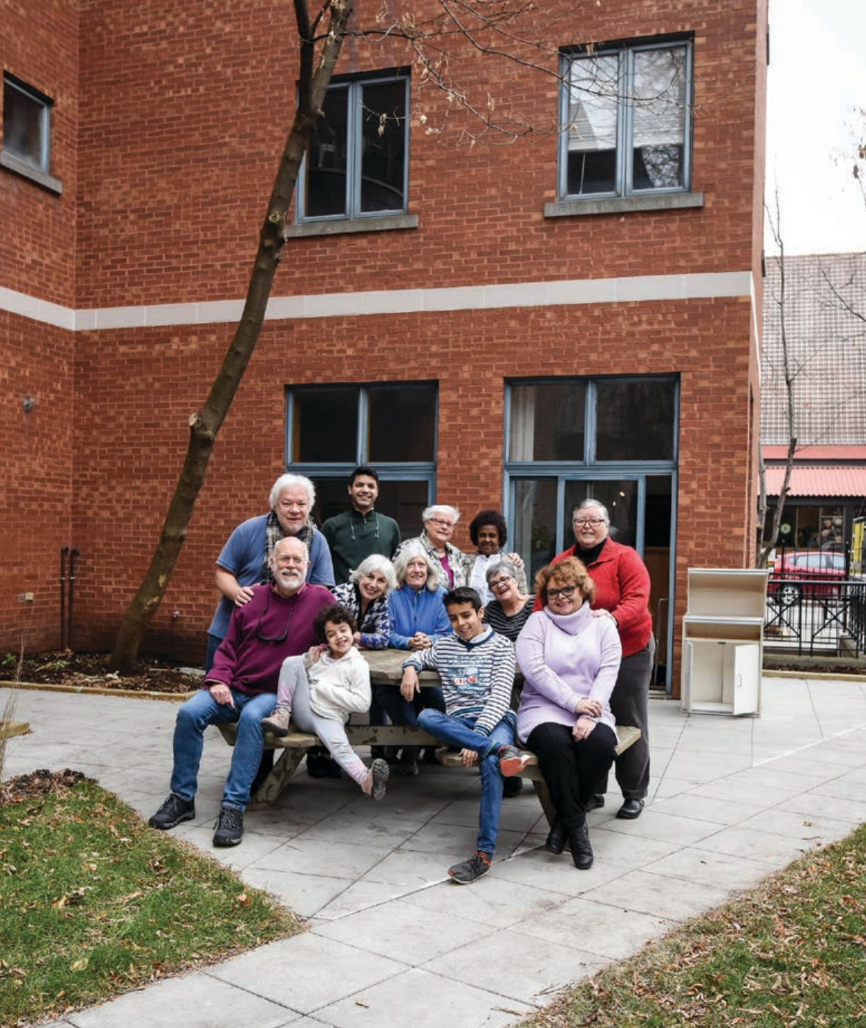
La Coopérative d'habitation L'Escale de Montréal , membre de la Communauté Milton-Parc, a bénéficié d'un refinancement en fin de convention avec la SCHL pour entreprendre des rénovations. Montréal